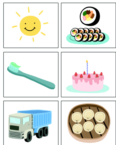
좌측 위로부터 시계방향으로 햇님, 김밥, 케익, 만두, 트럭, 칫솔